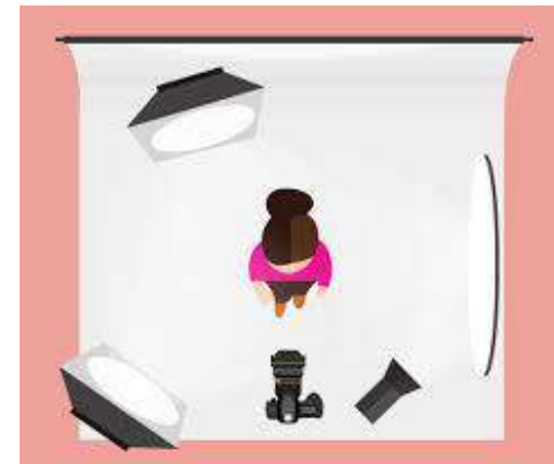
EXEMPLOS DE ESQUEMA DE ILUMINAÇÃO DE TRÊS PONTOS.