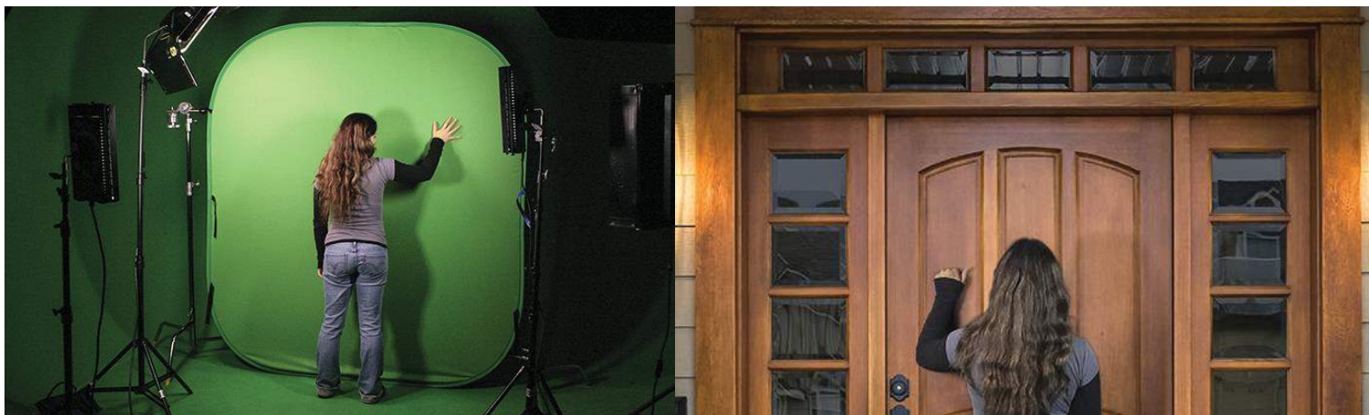
EXEMPLO DE GRAVAÇÃO EM ESTÚDIO CHROMA KEY E POSTERIOR APLICAÇÃO DO EFEITO.

Fundo: O fundo escolhido para captar o vídeo pode ser um cenário fixo e real ou um ecrã de uma única cor, usualmente azul ou verde, que permita depois a sua substituição por outro, usando o efeito chroma key .